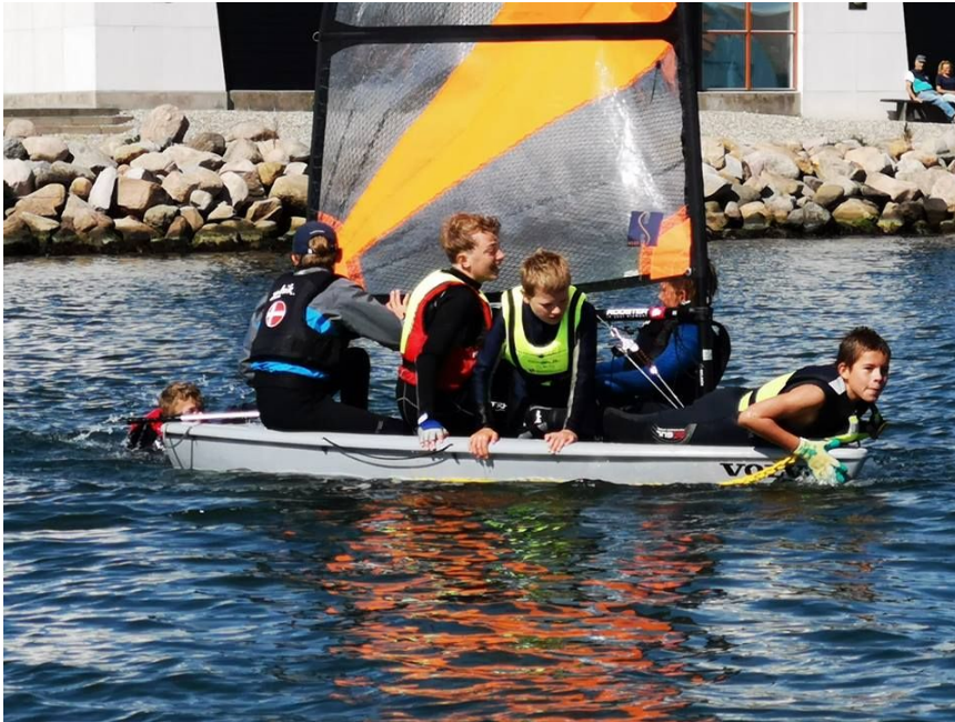
Tera - en glimrende jolle fra fem sejlere ... glem det :-)