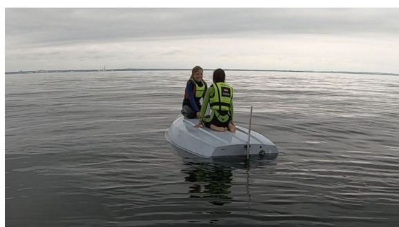
Kæntringer og tryghed på intro holdet