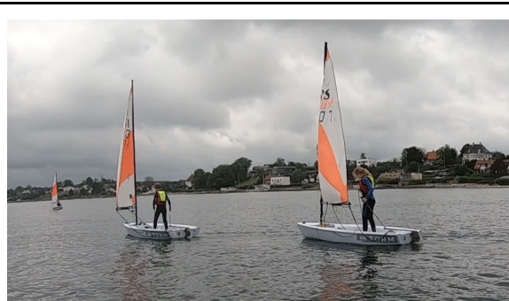
Balance på intro holdet